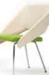
Design Ilkka Suppasein