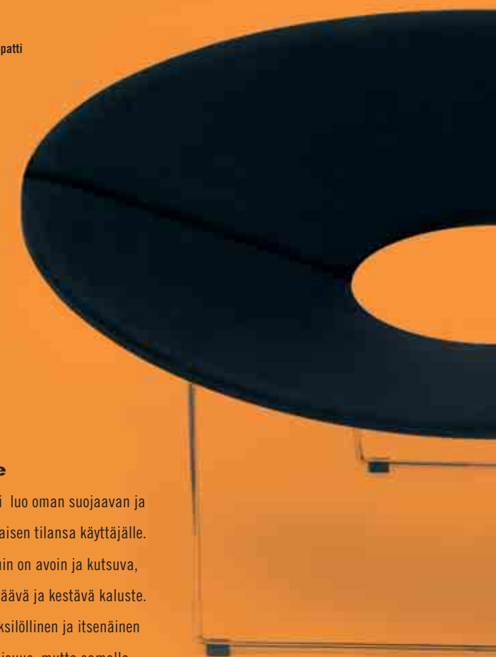
Design Timo Ripatti