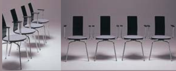
Oppli-2 / i / r